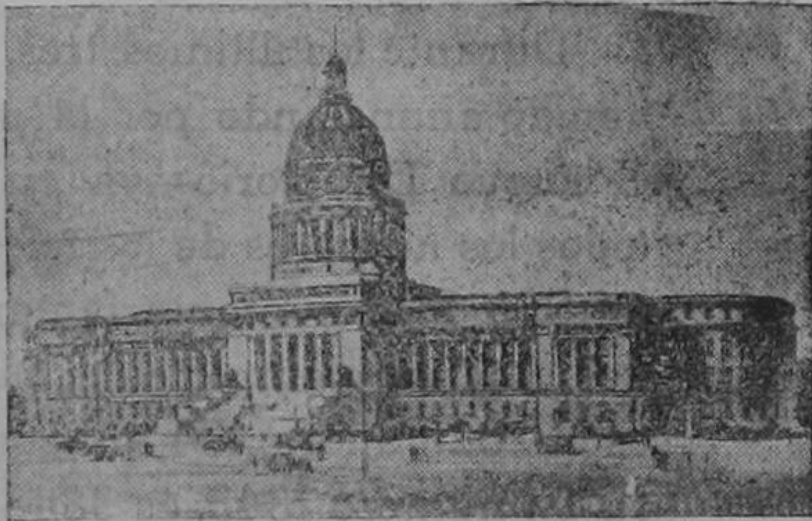
El Nuevo Palacio del Congreso de Cuba

Todos estos ascensores llevan los usuales dispositivos Otis de seguridad, mediante los cuales queda detenido el camarín en caso de romperse los cables. Tienen asimismo conmutadores de límite, que impiden que el ascensor se exceda de su carrera. En los ascensores de pasajeros las puertas están provistas de dispositivos de seguridad, de suerte que no puede ninguno arrancar mientras no estén cerradas la puerta exterior y la reja del camarín. Los camarines de los ascensores de pasajeros serán de metal y madera, de hermosa labor, y tendrán puertas laterales de emergencia. Las entradas de los ascensores de 42 pasajeros serán de bronce macizo.